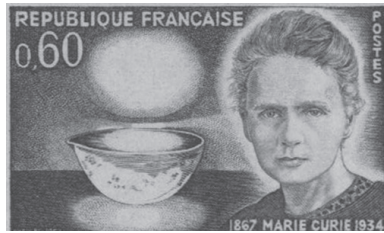
図1 マリー・キュリー

19世紀半ばのワルシャワに生まれたマリア・スクォドフスカは、いかにして科学者マリー・キュリーとなり、世界の偉人になったのだろうか。そして彼女の発見は、当時の世界でどのように受け止められたのだろうか。