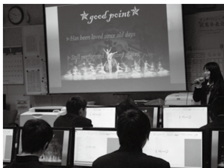
図2 生徒の発表風景

生徒はスライドの作り方や基本的なプレゼンテーション技術を情報科の授業で学んだ後、英語によるプレゼンテーションに挑戦する。そして冬季休業中の英語科宿題として、英語プレゼンの流れとスライドのラフスケッチを作成する。英語科教諭は、3学期最初の授業で提出された内容を添削し、アドバイスを行う。そして英語科と情報科で決定したスケジュールを教職員に公開。全生徒の準備が整った後、本番の発表を迎える。