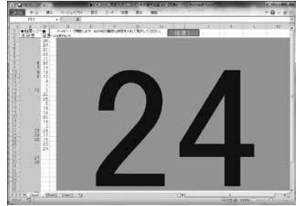
図1 発表順抽選ソフトの画面

発表順は、完全な抽選による。誰が発表するかは、その場にならなければ担当教諭にもわからない。順番を決める抽選ソフトはExcel VBAによる手作りだ。抽選ソフトのプログラム内容を生徒に公開し、