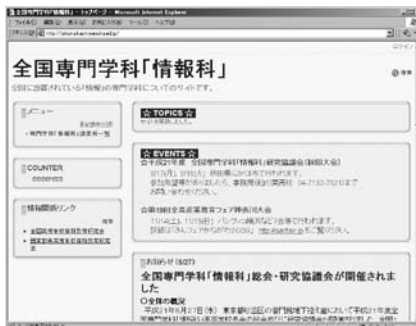
全国専門学科「情報科」ウェブサイト http://johoka.kashiwanoha.ed.jp/

また、プレゼンテーションの技術について、アップルジャパンの方に指導をしていただきました。プレゼンテーション技法の説明の後、実際に生徒にプ