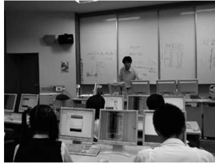
プログラミング講座の様子

昨年度末に入門講座を実施していただき、ヒューマノイド型ロボットについての説明と、ロボットが