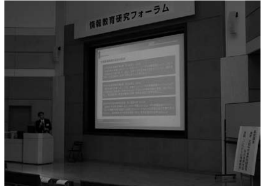
第1回フォーラムの様子