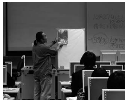
ポスターデザインの授業の様子