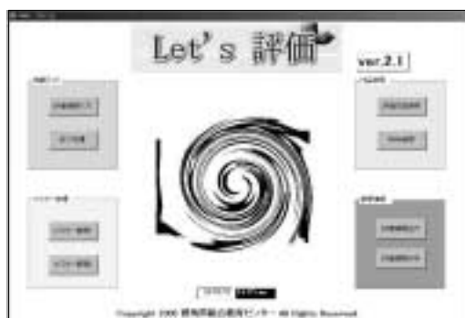
図1 「レッツ評価 ver.1.0」

こうした時代的問題提起を受けて私は、学習者が自己評価する能力を客観的に測定する方法を考案しました。(この測定方法は、特許 3668491 号を取得しています。)