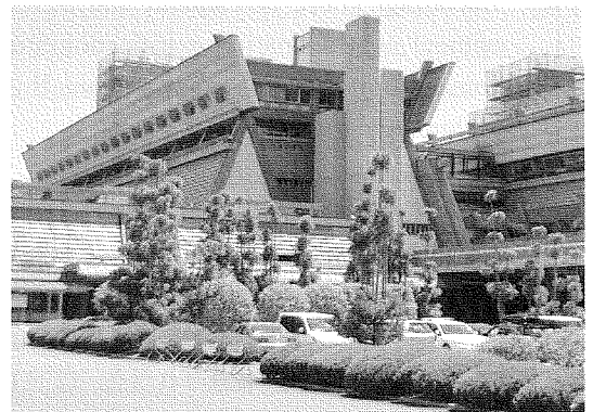
国立京都国際会館

平成25年は6月12日から14日まで国立京都国際会館で開催され、参加校は京都外大西高等学校、西大和学園高等学校、大阪YMCA国際専門学校、関西インターナショナルハイスクール、関西学院千里国際高等部、岡山学芸館高等学校、関西創価高等学校、洗足学園中学高等学校、立命館高等学校、立命館宇治高等学校の10校(225名)でした。