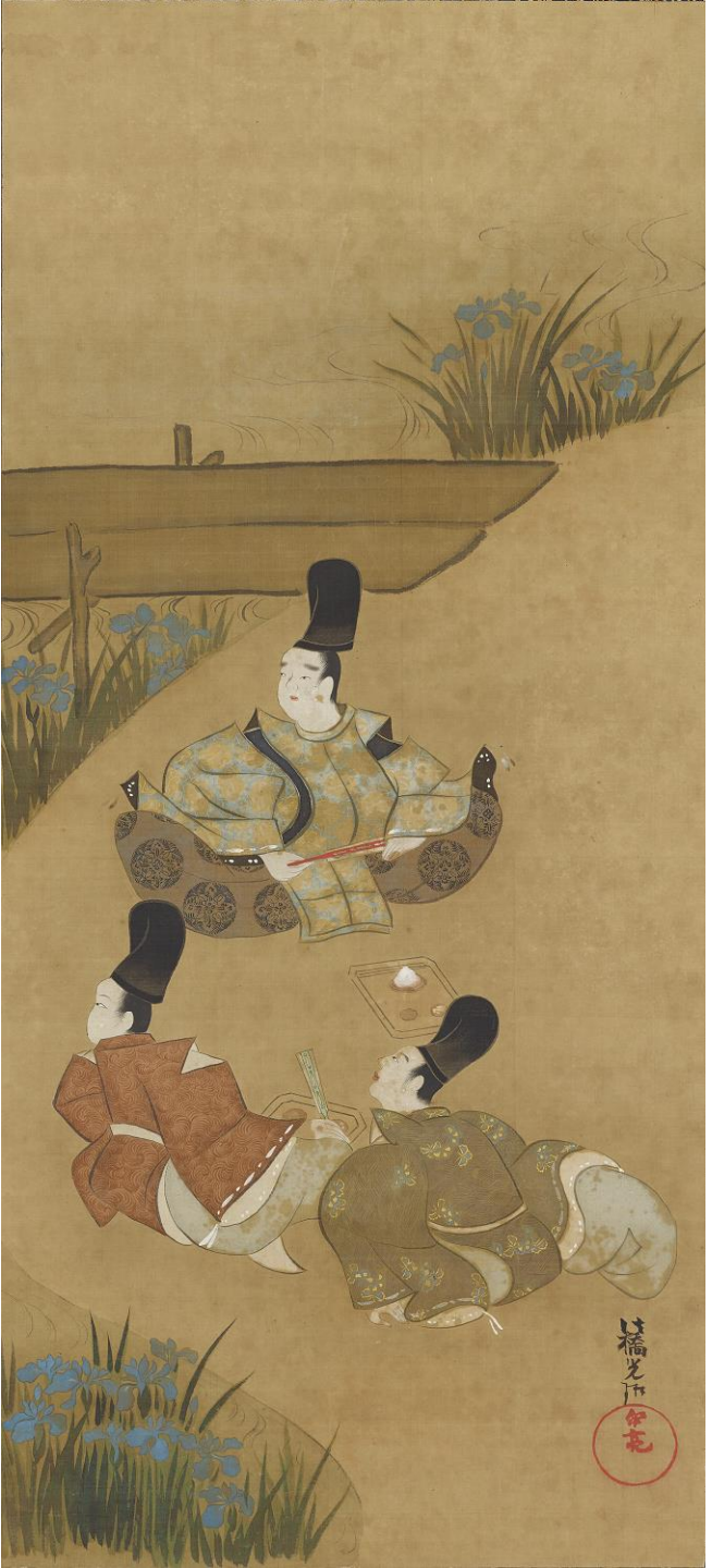
伊勢物語八橋図（尾形光琳筆）