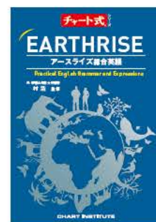
参考書 チャート式シリーズ EARTHRISE 総合英語