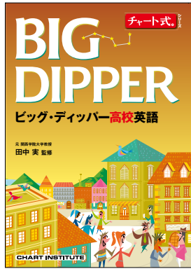
参考書 チャート式シリーズ BIG DIPPER 高校英語