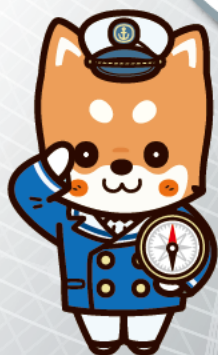
数研出版公式キャラクター 数犬チャ太郎

書籍全般・数研オリジナルグッズについての詳細は ホームページでもご案内しています。