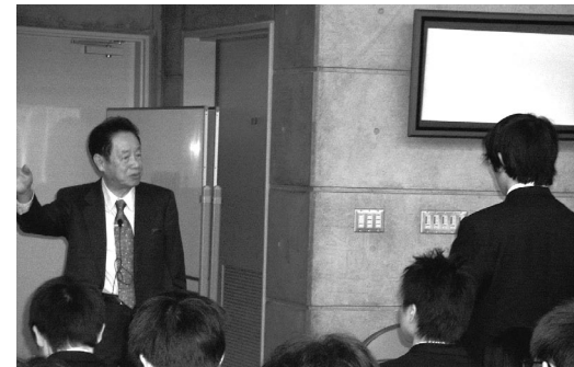
図3 江崎玲於奈先生の特別授業の様子