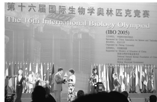
図6 IBO 北京大会 授賞式の様子

JBO 第一次国内選考試験は, 細胞生物学, 動物の解剖及び生理, 植物の解剖及び生理, 遺伝及び進化, 生態, 系統と分類, 行動の7分野から計50問出題されました(100点満点 平均点43.5点)。