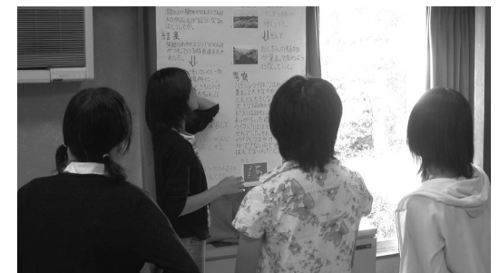
図4 生徒によるポスターセッションの様子

地学実習(三原山)・生物実習(植物の乾性遷移・磯の観察実習)～まとめ・ポスター作成～ポスターセッションを2泊3日の中で行い、課題研究の基礎を学ぶ良い実習となりました(図4)。