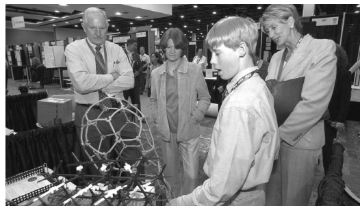
図5 Intel ISEFの様子

がアメリカ アリゾナ州フェニックスで行われ, 世界中45ヶ国から1447人の高校生が自分たちの研究を披露しました。今回, 日本から参加したのは, JSSAの2プロジェクト(4名)と, JSECの3プロジェクト(5名)です。