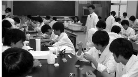
図1 先端科学授業風景(生命科学:遺伝子組み換え実験)

の中から35名で1クラスを編成し、通常授業の木曜日5・6時間目に、物理・化学・科学英語を順番実施しています。また、課外活動として科学ゼミナール、ロボットゼミナール、建築ゼミナールを開設し、コンピュータ部と協力して活動しています。