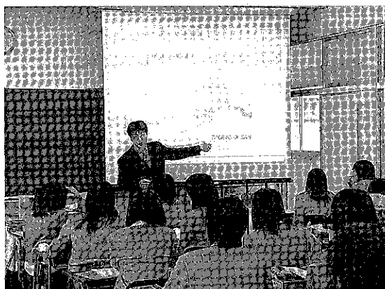
▲ スライド・ショーを利用した授業

音声を流せるほかに、スクリプトすべてを表示したり、passage, question, answerなどを自由に表示することができます。これにより、Listening のフォローが楽にできるようになりました。